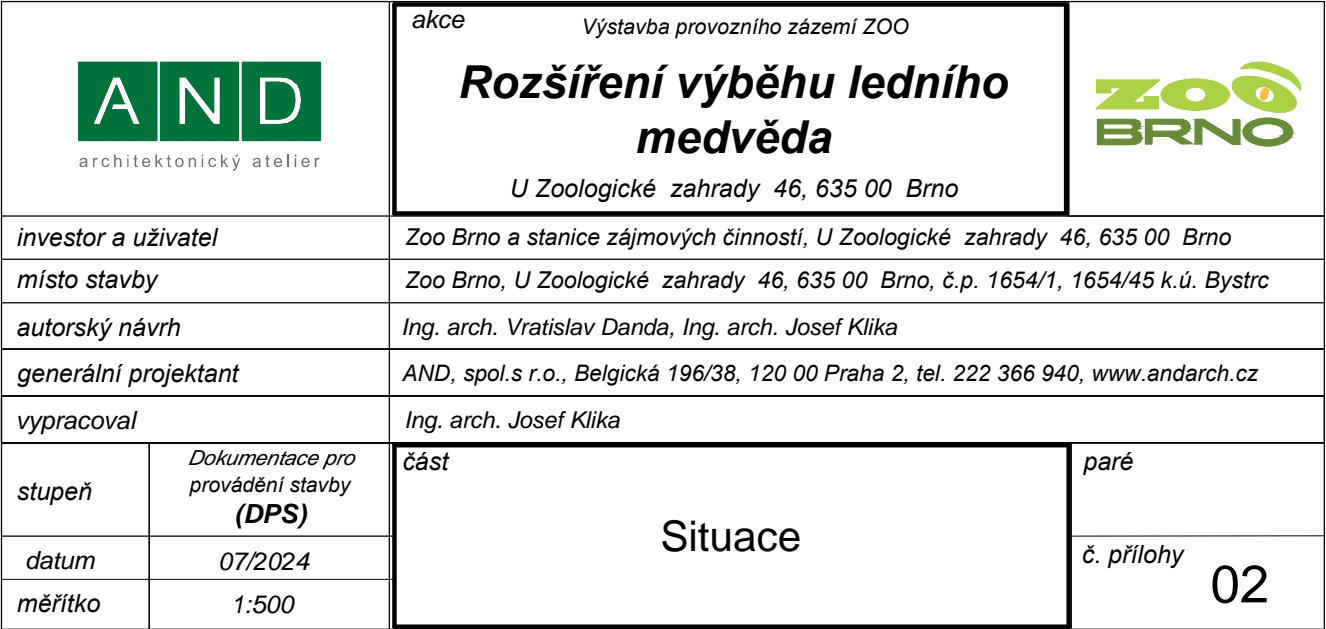
SO 02.1 ASŘ

Výškový systém Bpv ±0,000=221,70 m n.m. Polohový systém S-JTSK